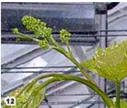
12) 4-6 feuilles déployées, inflorescence visible