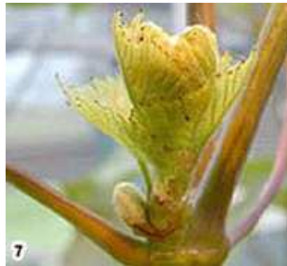
7) Première feuille déployée