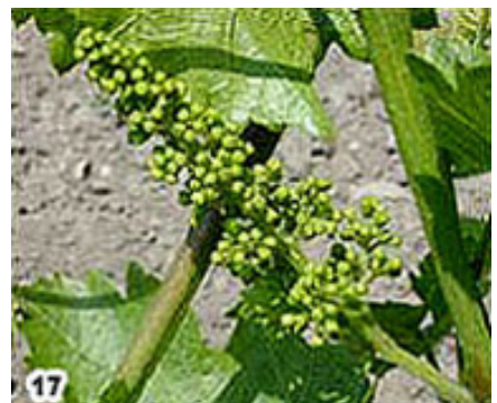
17) Boutons floraux séparés