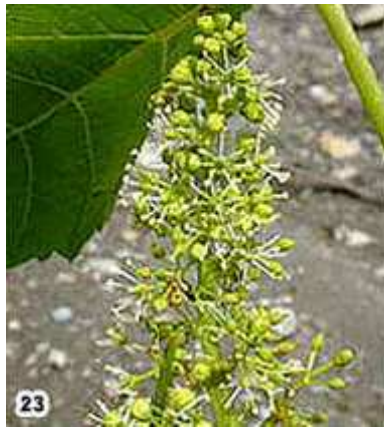
23) 50 % floraison