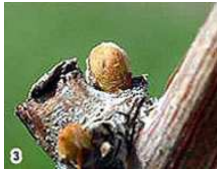
3) Bourgeon dans le coton