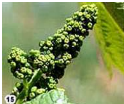
15) Allongement de l'inflorescence, fleurs pressées l'une sur l'autre