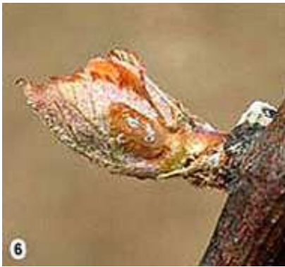
6) Pousse verte