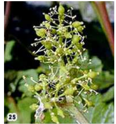
25) 80 % floraison