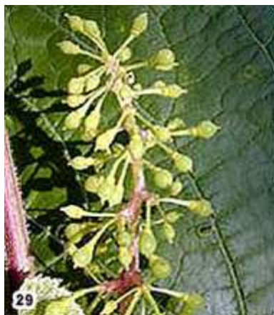
29) Baies de la taille d'un plomb (4-6 mm)