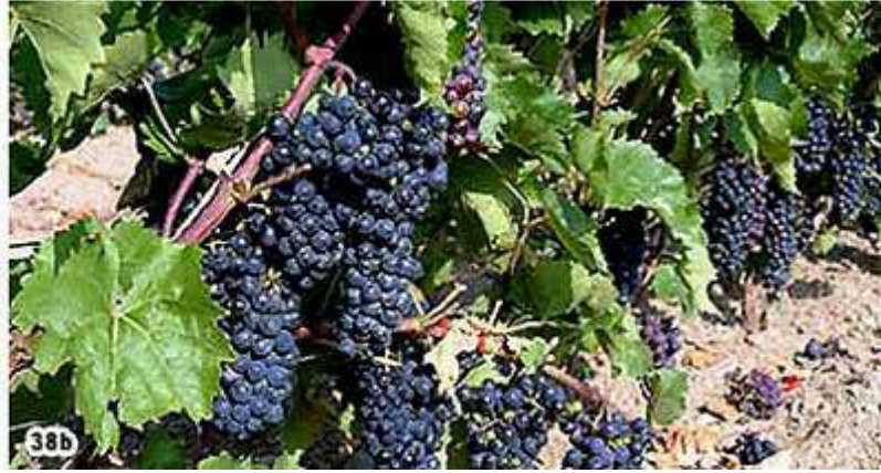
38) Récolte à maturité