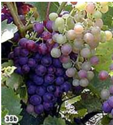
35 ) Début Véraison