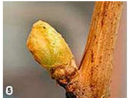
5) Pointe verte