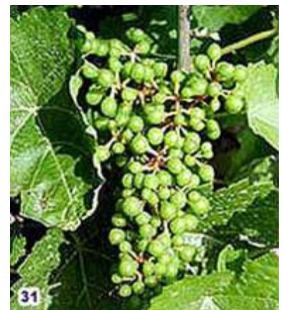
31) Baies de la taille d'un pois (7-10 mm)