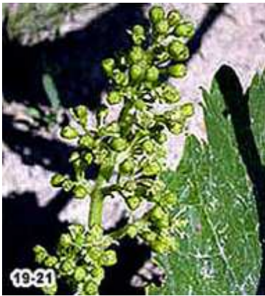
19) Début floraison, chute du premier capuchon 21) 25 % floraison