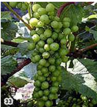
33) Fermeture de la grappe