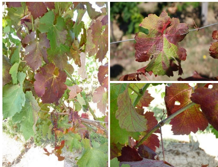
Exemples de symptômes de flavescence dorée / bois noir

Ces symptômes peuvent beaucoup varier selon les cépages. Pour des illustrations complètes, n'hésitez pas à consulter la galerie photo du GDON des Bordeaux en cliquant ici .